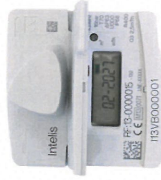
Intelis LCD display